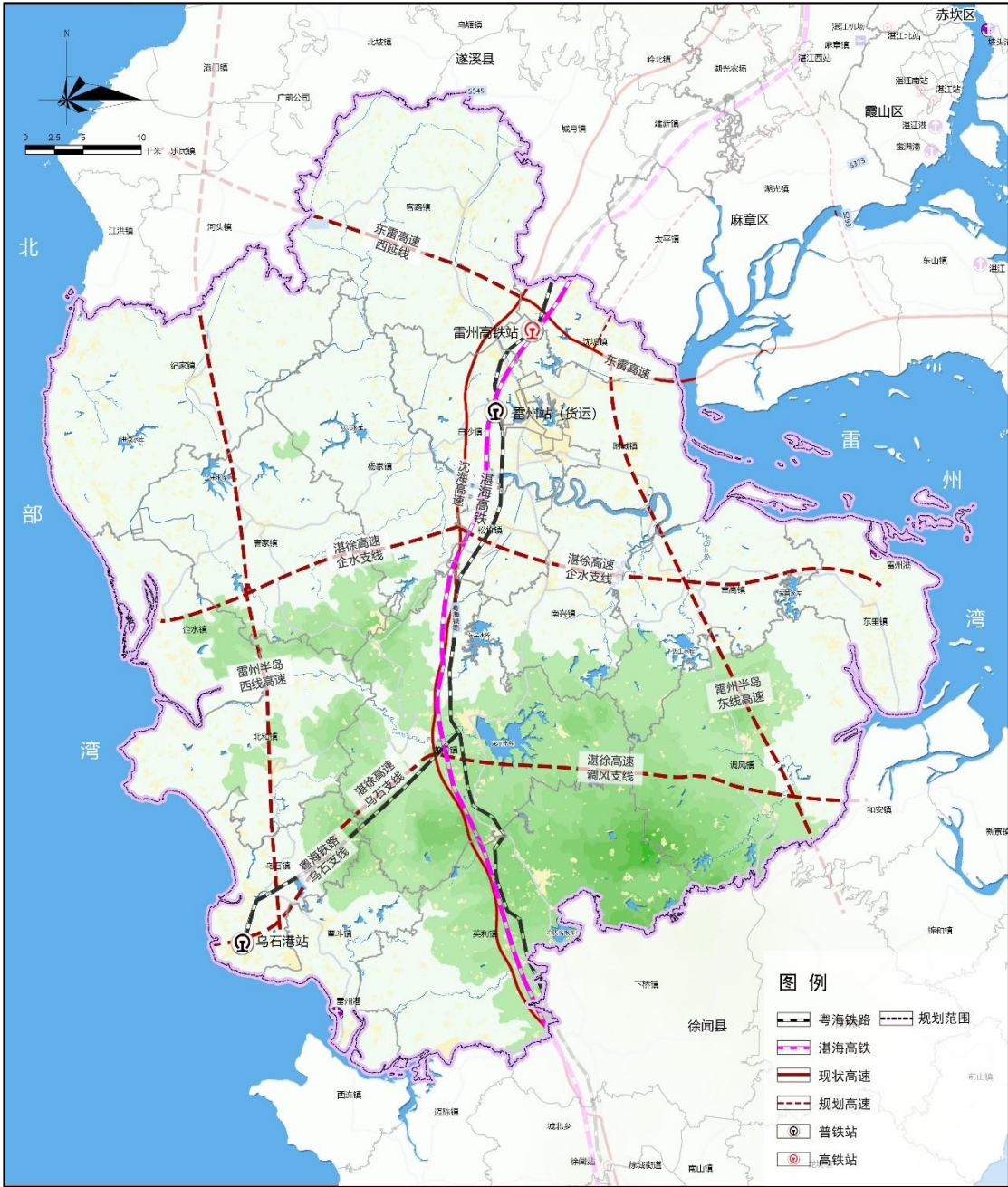
图 3 雷州市铁路、高速公路规划示意图

道。到 2025 年，基本形成对外快速出行交通圈，基本实现陆路 2 小时左右通达广州、深圳等粤港澳大湾区核心城市。