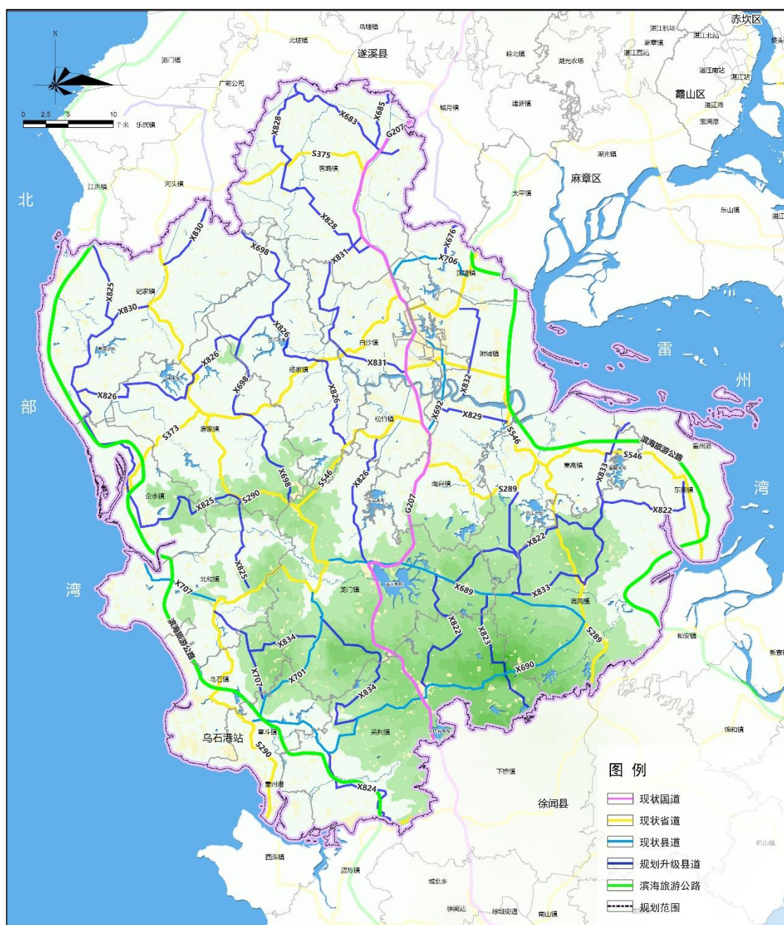
图 4 雷州市国省道及旅游公路规划示意图