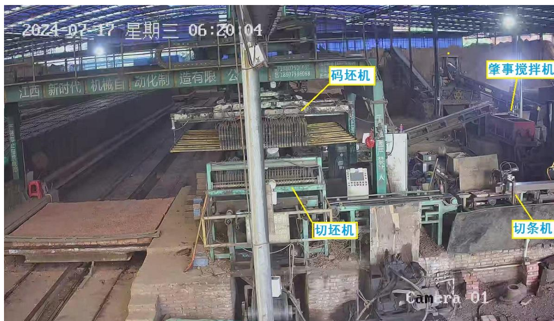
图 2 事故发生在制砖生产线的搅拌机位置

宏鑫砖厂制砖生产线主要包括原料制料、制坯、烧结三个环节；其中制坯生产设备包括搅拌机、切条机、切坯机、码坯机；事故发生在制坯环节的搅拌机位置，如下图 2 所示：