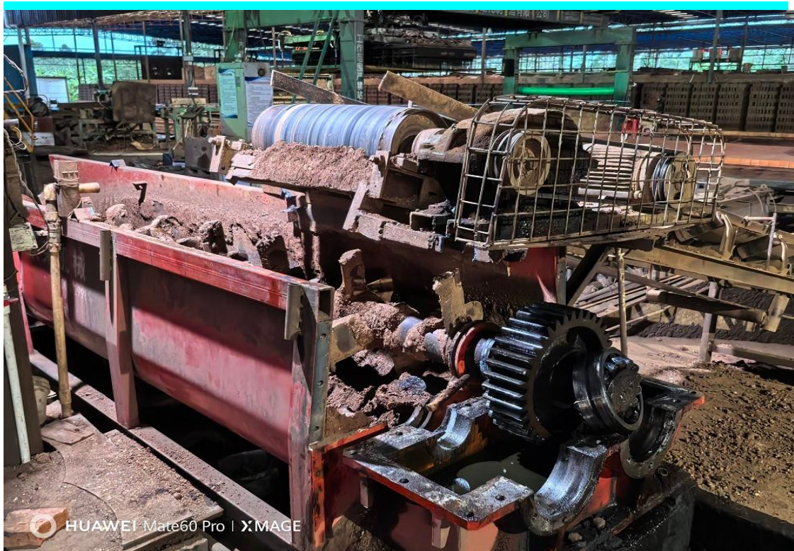
图 6 事发搅拌机侧后方视角情况