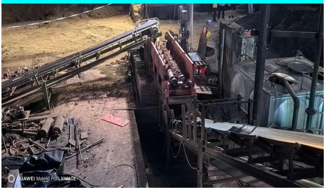
图 3 搅拌机前后都设置有皮带机

事故发生后，现场救援人员将一条搅拌轴拆下，才将周妃六的身体从搅拌轴中取出。现场情况如图 3 至图 7 所示：