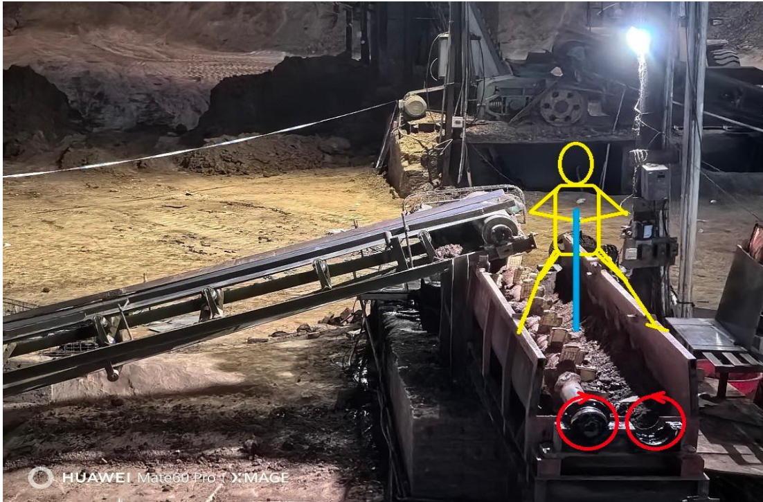
图 10 周妃六爬上搅拌机槽站在两边持铁铲清理体形示意图