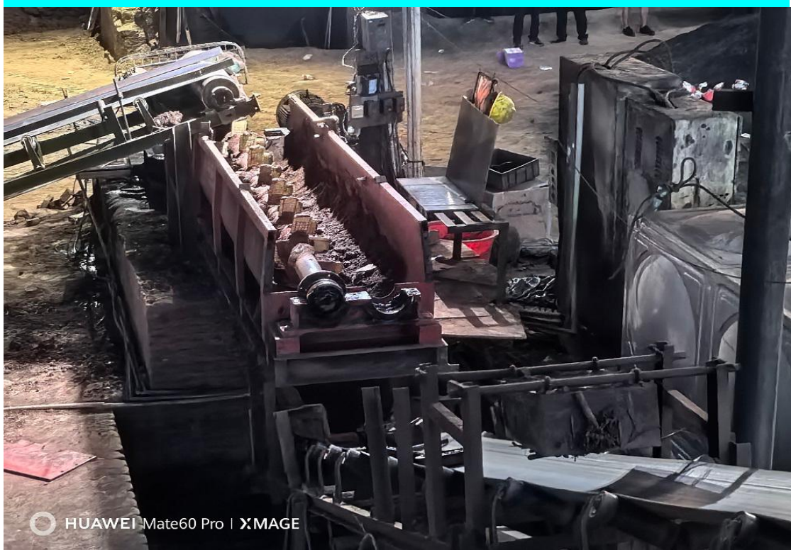
图 5 事发搅拌机近距离视角情况