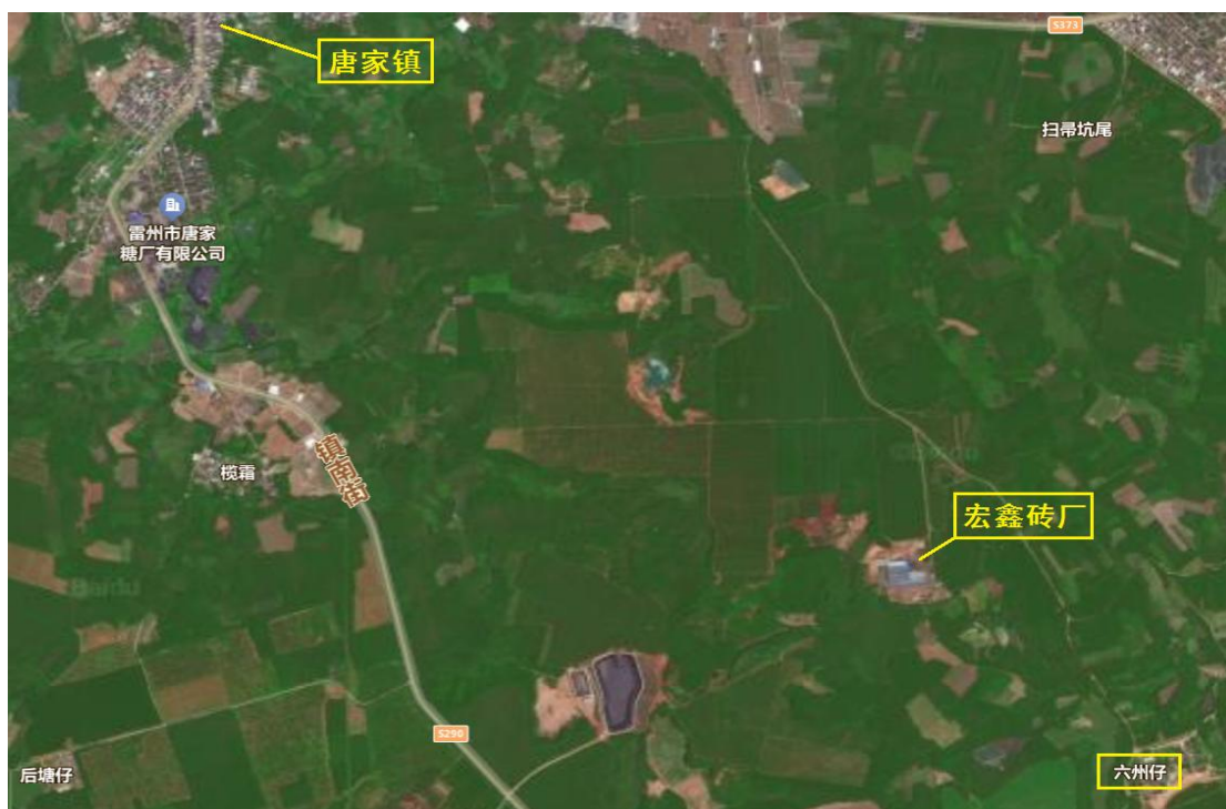
图 1：宏鑫砖厂地理位置示意图