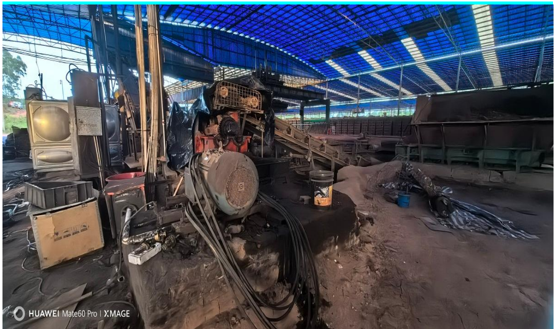
图 4 事故搅拌机后方情况