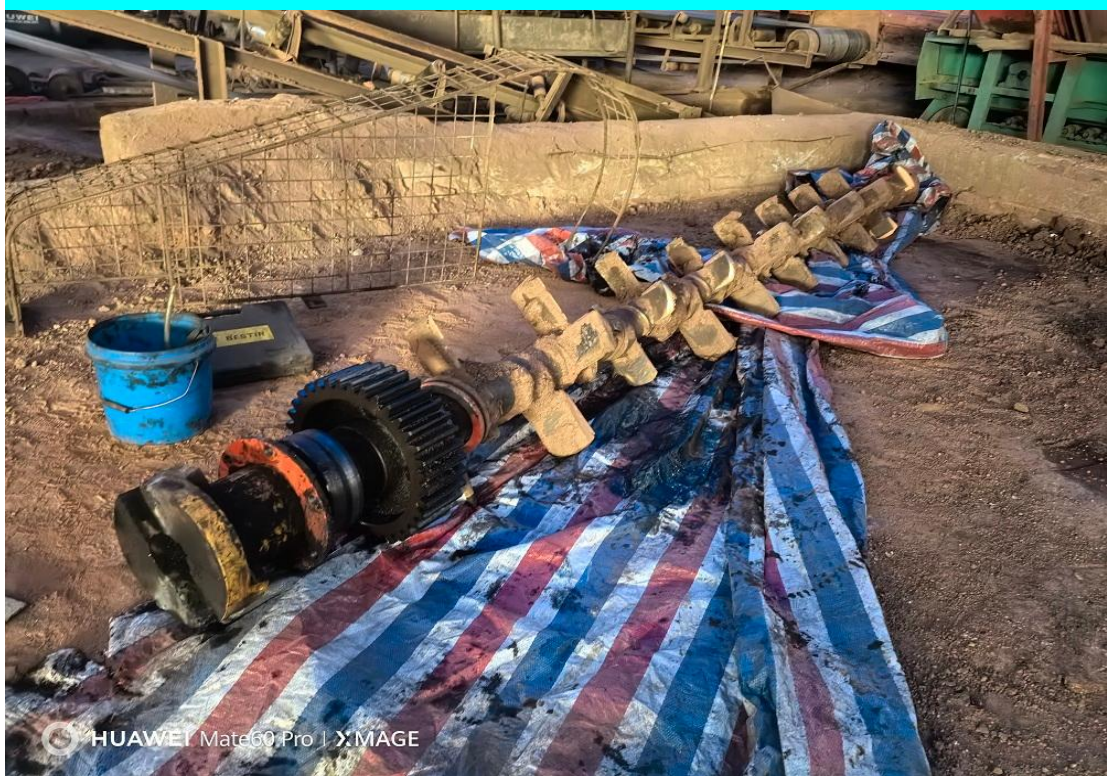
图 7 救援人员现场拆卸下的一条搅拌轴